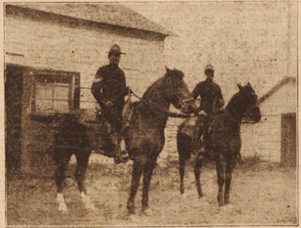
Kanadische berittene Polizei. (Mit Text.)

wählt hatten, eingenommen hatte, bemächtigte sich der Anwesenden großes Zagen und Bangen, denn sie fürchteten, daß ihr Landesherz seine Rechte überschreiten würde. Ärgerlich blickte der Erzbischof um sich, aber niemand hatte sich von seinem Platze gerührt.