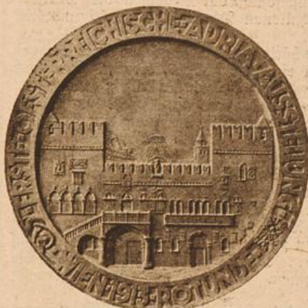
Erinnerungsmedaille an die österreichische Adria-Ausstellung. (Mit Text.)

Endlich blieb der Erzbischof stehen und wandte sich an die Versammelten. „Meine Herren,“ begann er, „wir haben schon länger gewartet, als eine zu weitgehende Höflichkeit es verlangt. Wie sehr Graf Winneburg unsere Beratungen achtet und schätzt, zeigt ja seine unentschuldbare Vernachlässigung des Amtes, das Ihr ihm übertragen habt und das er mit Freuden angenommen hat. Ich werde jetzt daher seine Stelle vertreten und ich bitte euch, Ihr Herren, zur Beratung Platz zu nehmen.“