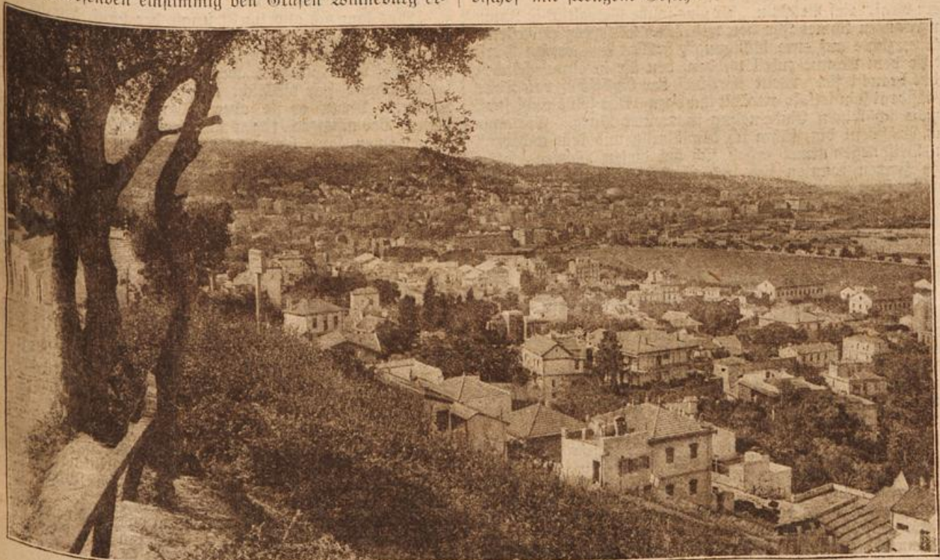
Stad anj Algier. (Mit Text.)

„Soll das vielleicht eine Drohung sein?“ fragte der Erzbischof mit strengem Gesicht.