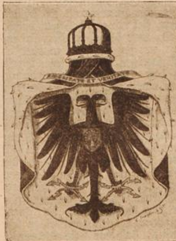
Neues Staatswappen Albaniens. (Mit Text.)

„Ich bitte Platz zu nehmen. Die Versammlung ist eröffnet.“