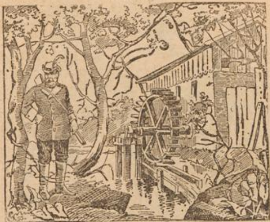
Wo ist die Mädelstöcher?

Eine afrikanische Maisischemme. Der Mais lagert, um gegen Termiten gesichert zu sein, unter dem Dache. Im Innern der Hütte ist ein Fetisch aufgestellt, der den Mais vor Dieben bewahren soll.