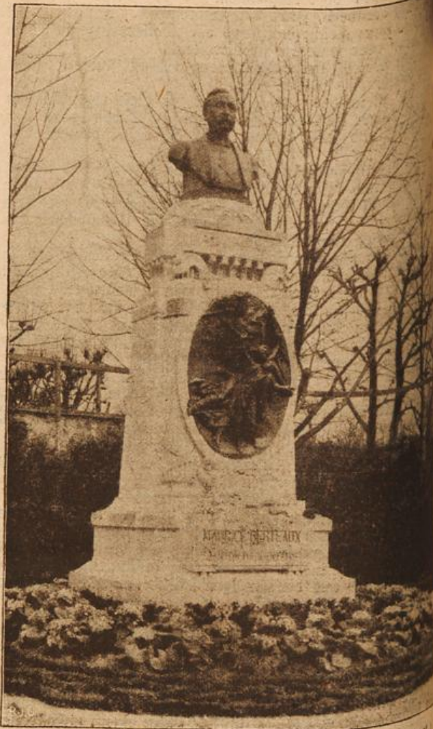
Denkmal für die Flugkatastrophe in Argentinien. (Mit Text.)

Ihr Ritteraal ist nicht kleiner als der in dem besetzten das dem Kurfürsten gehört. Für alle Mitglieder des ist meine Burg bequem zu erreichen, und sie sind in ihren als Gäste willkommen. Meine Keller sind voll mit edlem und meine Vorratskammern gefüllt. Alles, was sich von Cochem sagen läßt, gilt auch von der Winneburg. Ich daher die Mitglieder des Landtages mit meinem Dach begnügen, so mögen sie es als das Ihrige betrachten. Begeistert brachen die Edlen dann in den Ruf aus: „Ja, so sei es! Winneburg ist der richtige Platz.“