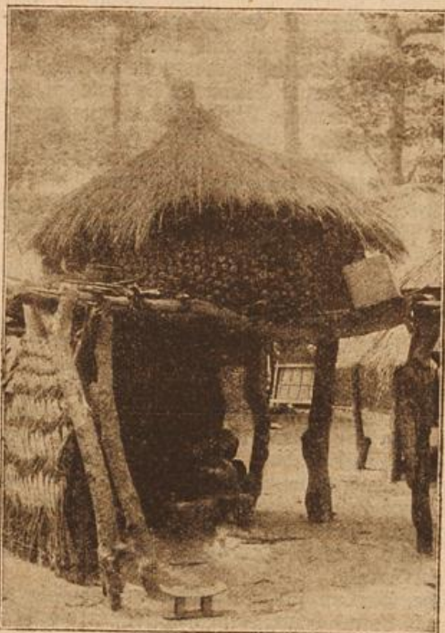
Eine afrikanische Maischütte. (Mit Text.)