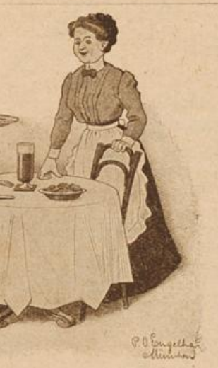
Unerwartete Replik. Gast: „Sie, das Weckst ist aber etwad klein, das paßt gerade für einen hohlen Zahn!“ Kellnerin: „So, san's froh; a Plomben kostet jhna mindestens zehn Mark!“

Zum vollkommenen Ausbau von Qualitätsweinen ist deren Füllung immer notwendig, da sie gerade auf der Flasche ihre Endreinigung durchmachen und danach sich niemals zum Nachteil verändern, weil die Flaschenweine von der Luft abgeschlossen sind.