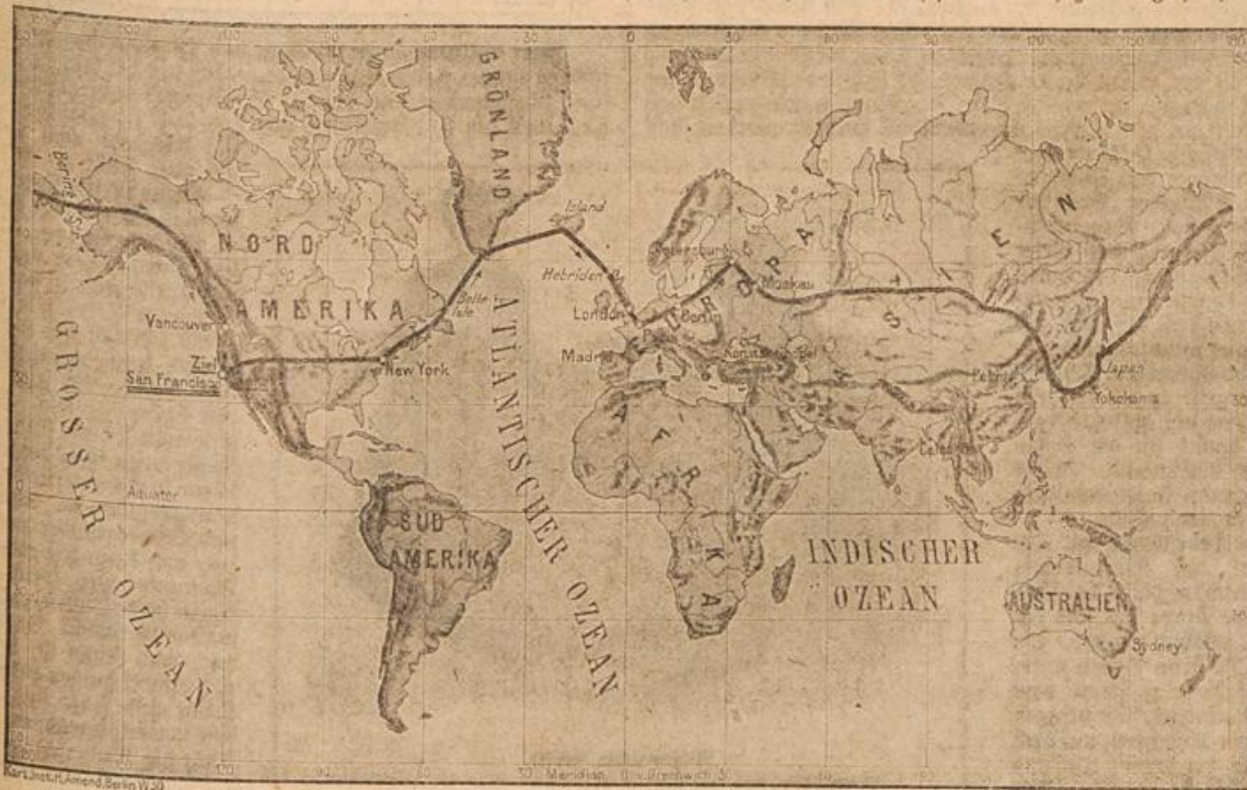
Ein Flug um die Welt. (Mit Text.)

Schließlich aber blieb Ei- senstück keine Wahl, er mußte den Eid schwören, wurde dann aber im Verkehr und im gesellschaftlichen Leben etwas harthörig.