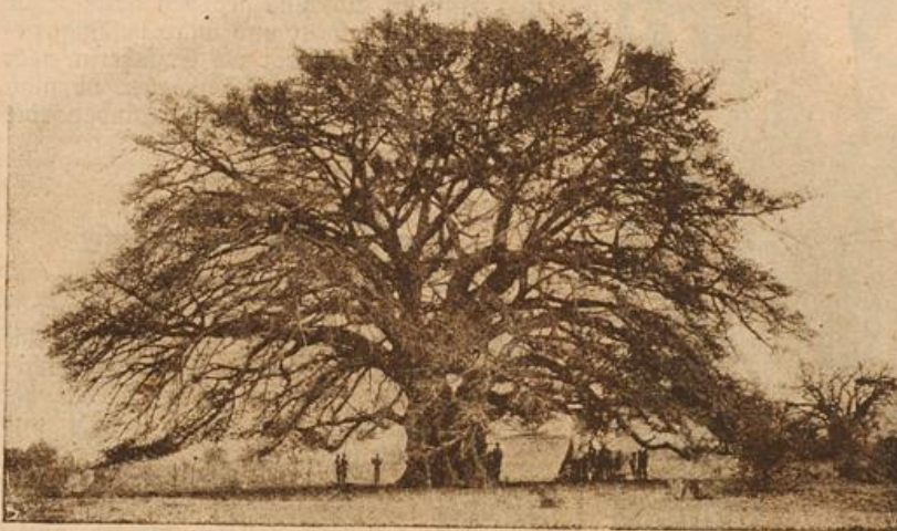
Ein Felsenfeigenbaum im Schwäblande. (Mit Text.)

Endlich aber sagte Gretchen: „Ach, wie ungeschickt von mir, ich habe Ihnen ja noch gar nicht gratuliert; meine besten