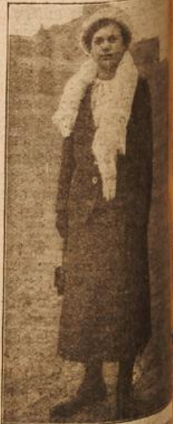
Eine 13jähr. Lebensretterin. (Mit Text.)