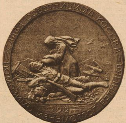
Eine Medaille des serbischen Invalidendanks. (Mit Text.)

Blick umfing die liebliche Gestalt mit unverhohlenem Behagen. „Es ist geradezu empörend!“ dachte Gretchen. Sie mochte ihrer knienden Stellung aufgesprungen und stand nun vor in all ihrer aufblühenden Schönheit.