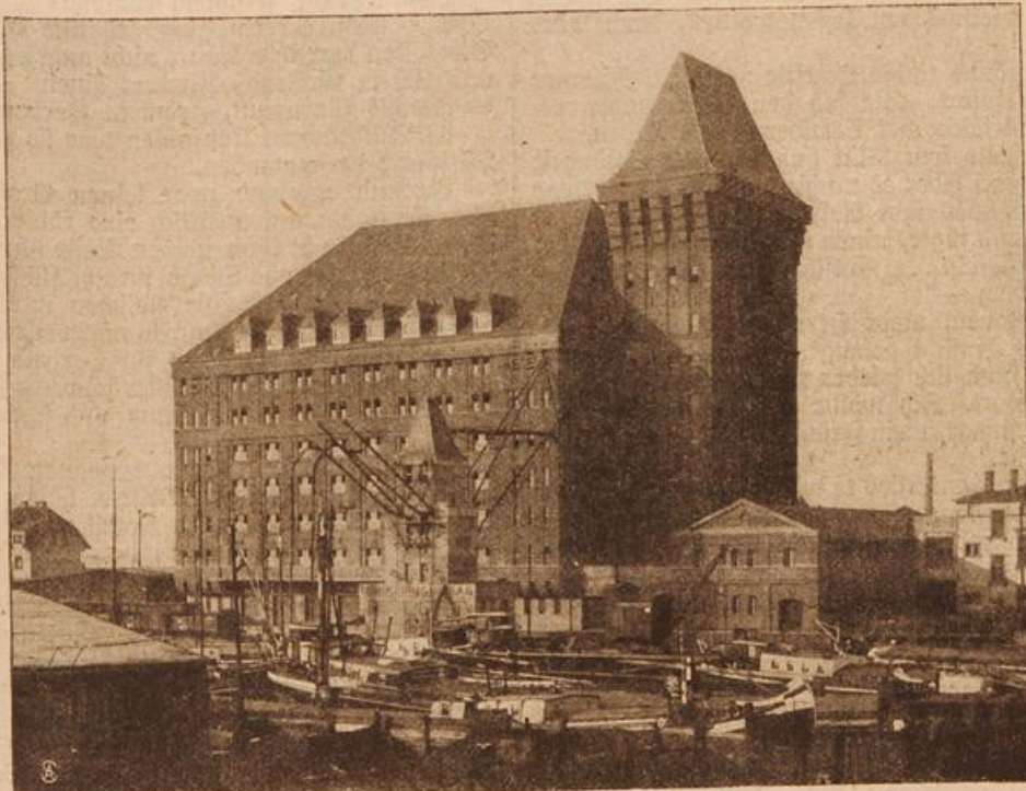
Ein neuer moderner Getreidespeicher am Duisburger Binnenhafen. (Mit Text.)

Wenn Gertrud nicht so einsam gelebt hätte, würde sie sich in den Verkehr mit diesem einfachen, ungebildeten Mädchen wohl kaum eingelassen haben, aber sie war das einzige menschliche