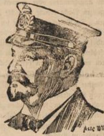
Aus dem Reich.