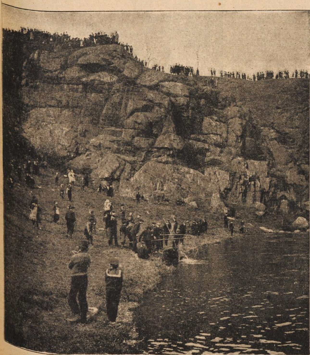
Eierschieben am Fuße des Proitschenberges.