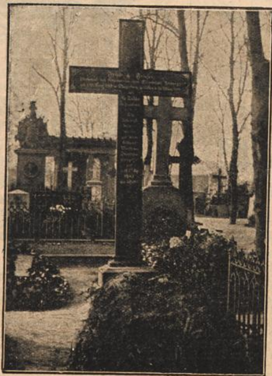
Das Grab Friedrich Friesens auf dem Invalidenfriedhof in Berlin.