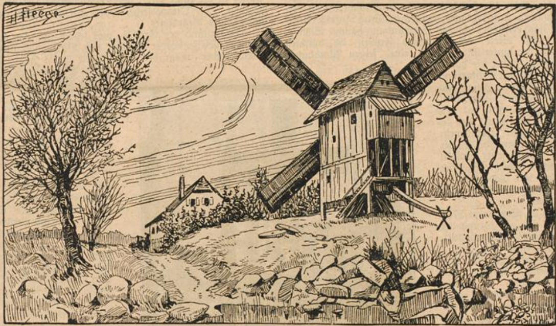
Wo ist der alte Müller und sein Knecht?

veröffentlichte Statistik der europäischen Briefkästen bemerkenswert. Den Ruhm, das briefkastenreichste Land Europas zu sein, darf hiernach das Deutsche Reich einheimsen, denn es birgt in seinen Grenzen nicht weniger als 153 187 Stück dieser nützlichen Einrichtungen. An zweiter Stelle steht Frankreich mit 83 100, an dritter Großbritannien und Irland mit 69 332 Briefkästen; dann folgen Österreich mit 43 317, Italien mit 36 270 und Rußland mit 27 769 Briefkästen. Am Ende der langen Liste finden wir