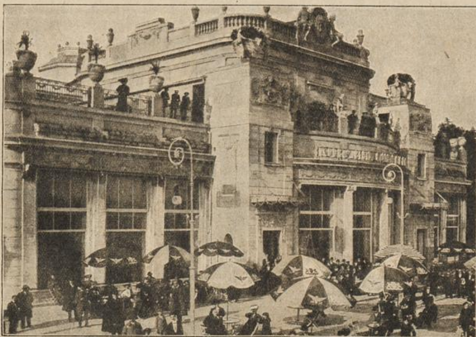
Der Kurjaal in Abbazia.