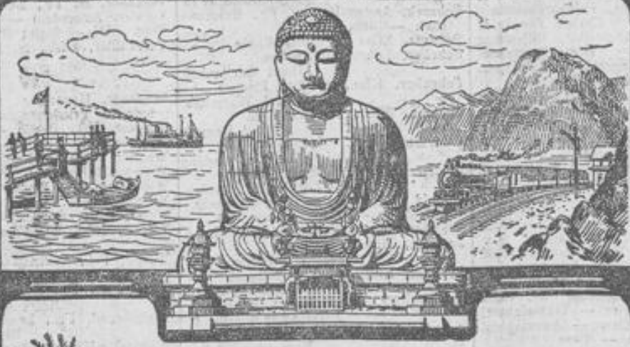
mit dem Doppelschrauben-Postdampfer „Cleveland“.