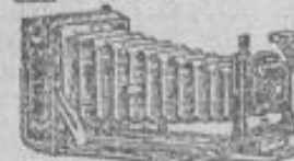
Photo-Apparate neueste Modelle renommiertester erster Fabriken mit Objektiven von Voigtländer, Goerz, Meyer, Rodenstock, Plaubel u. a.

Als billiges Glas, gelblicher Konstruktion, empfehlen wir speziell für Sport und Reise das sehr lichtstarke, elegant ausgestattete Armee-Fernglas Mk. 36.50 neuestes Modell, mit ca. 5 1/2 mal Vergrößerung inkl. festem Leder- Etui mit Riemen zum Umhängen gegen Monatszahlungen. Verlangen Sie per Postkarte Auswahlendung 6 Tage z. Ansicht ohne Kaufzwang. Fernes gegen erleichterte Zahlungen