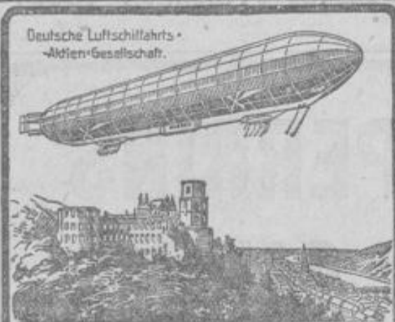
Deutsche Luftschiffahrts- Aktien-Gesellschaft.

S. Mathias & Co., Eckhaus Weber- u. Spiegelgasse.