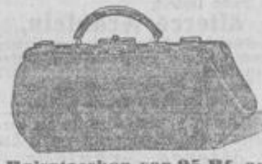
Reisetaschen von 95 Pf. an bis zu den feinsten Kinnledertaschen.