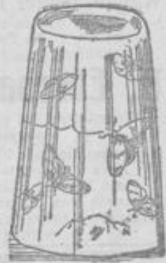
Vergnügte Motten unter einem Glase mit Kampfer.

Eine lebende Motte in ein umgestülptes Glas mit Kampfer, Naphthalin oder sonst eines der bekannten Mottenvertreibungsmittel gesetzt, wird darin vergnügt und munter weiterleben.