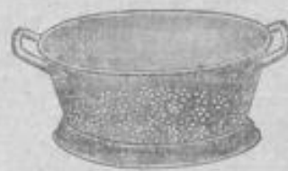
Salat-Seiher ca. 22 cm Durchm. 95 Pf.