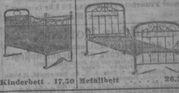
Kinderbett 17.50 Metallbett 26.50