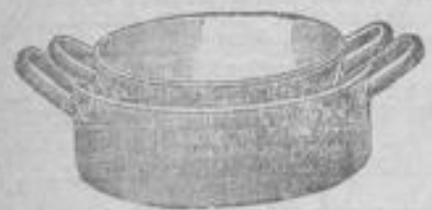
Nudelpfannen Satz = 2 Stück 95 Pf.