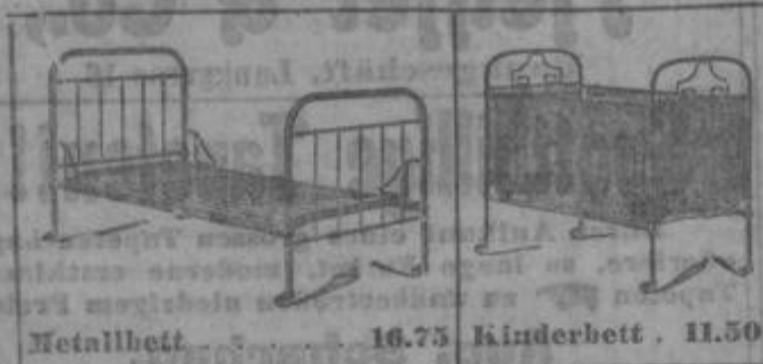
Metallbett 16.75 Kinderbett 11.50

Tischdecken in grosser Auswahl 1.95 Diwanddecken in Kelimgeschmack 4.75 Kamelhaardecken, garant. rein und gemischt 6.50 Schlafdecken in Halbwohle und Baumwolle 2.25 Steppdecken, vorz. Füllung, gleichseitig u. m. Reformfutter, 12.50, 9.50 5.50 Dekorationsstoff, 130 cm, mod. Muster 1.50 Rouleau-Damast, 180 cm breit, Meter 1.95, 1.15 95 Dekorationsherde, Leinwand, Meter 55, 68, 42