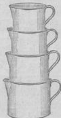
Töpfe mit Fussguss Satz = 4 Stück 95 Pf. Kasserollen mit Stiel, Satz = 3 Stk. 95 Pf. Wannen, rund, ca. 36 cm Durchm. 95 Pf.