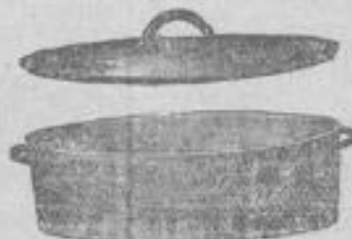
Bräter, oval, mit Deckel, wie nebenstehende Zeichnung, inoxydiert . . . 95 Pf.