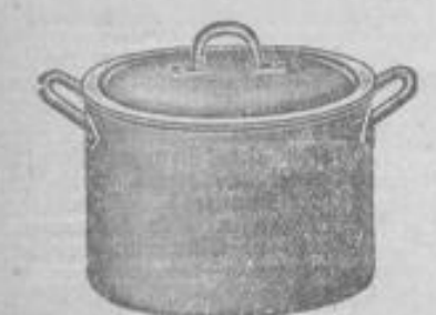
Emaillie-Kochtopf mit Deckel, ca. 22 cm 95 Pf.