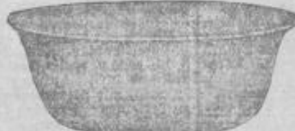
Küchenschüssel, tief. 95 Pf.