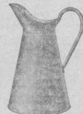
Wasserkrug 95 Pf.