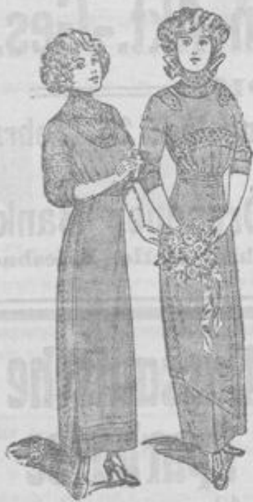
Kleid aus gutem Wollstoff, Kordureuz und Spitzenverzierung Mk. 39.—