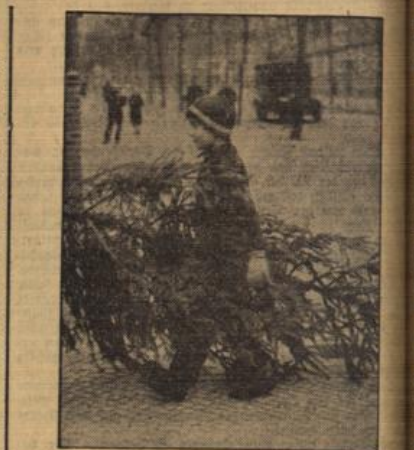
Ein Heiner Gehilfe des Weihnachtsmannes. (Weltbild, M.)

Außerdem ist höchste Eisenbahn, denn Weihnachten steht vor der Tür. Aber ein Entschluß ist nicht Wiesbadener Sache. Er hat ja auch zu allem etwas auszusagen. Arbeitsbeschaffung? Was geht das Wiesbadener an. Er hat genug zu tun, er muß nicht machen. Wiesbadener bringt natürlich auch kein Opfer. Dafür sind die anderen da. Ebenso wenig denkt Wiesbadener daran, einmal ein Zoo der Reichsoberste für Arbeitsbeschaffung zu spielen. Es könnte ja eine Idee sein. Dann hätte er ein Opfer gebracht und das will er doch nicht. Es wäre ja auch schade, wenn Wiesbadener einen Gewinn gezogen bekäme, denn die sollen Volksgenossen zugute kommen, die am Werk des Führers mitarbeiten und nicht den Wiesbadenern.