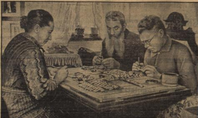
Hier entsteht unsere WSW-Plakette. Die Winterhilfsabzeichen für den Monat Dezember, bunte Holzfiguren, die Engel, Jwerge und Elfenäuer darstellen, wurden in Gießen, im Erzgebirge und in der Eifel hergestellt. Eine Heimarbeitstfamilie in Oßernhau im Erzgebirge beim Bemalen der Figuren. Auch Großvater hilft mit bei der Arbeit.

— Voraussicht: Frankfurt a. M. Wetterverhältnisse bis Dienstagabend: Zunächst verbreitete Regenfälle. Bei zeitweiliger kühleren ausströmenden südwestlichen Winden milder, später wieder mehr wechselnde Bewölkung.