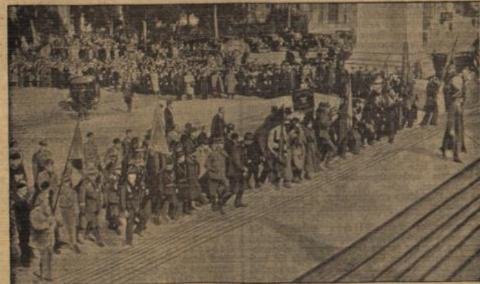
Frontkämpfer wollen Frieden.

Rechts vom Führer Generalfeldmarschall v. Blomberg, links Hermann Göring.