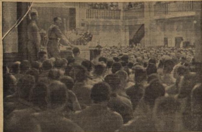
Der Führer im Bürgerbräukeller.