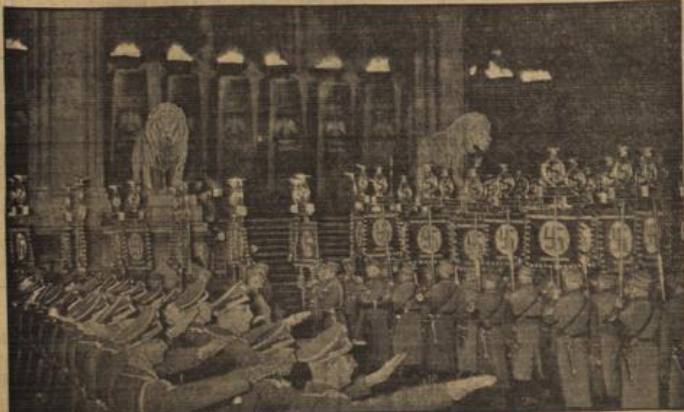
Die Standarten an der Feldherrnhalle.

In der historischen Gaststätte sprach der Führer am Vorabend des 9. November wieder zur Alten Garde.