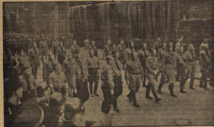
Der Marsch des 9. November.

In nächstem Zug sind die Standarten durch das Siegestor zur Feldherrnhalle gezogen. Im Hintergrund die Flammen-Pylonen, an denen die Kampfgenossen von 1923 die 16 Kränze niederlegten.