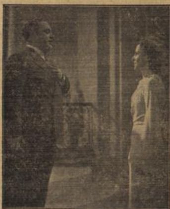
Benjamins Gigli und Käthe von Nagy in dem Synkron-Film „Ave Maria“.

bestimmen. Meine Frau behauptet, ich könnte das natürliche Wesen meiner Zähne nur wieder erlangen, wenn ich das Kaugummi gans aufbebe. Da ich das nicht möchte, bitte ich um einen Rat. Antwort: Nicht versuchen Sie einmal Chlorodont, um den besten Mundschutz zu erwerben. Jeden Abend regelmäßige Zahnpflege mit Chlorodont verhindert gleichzeitig die Neubildung des Zahnelgates und macht den Atem frisch und rein.