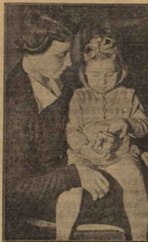
Spare in der Jugend — dann hast du im Alter! Zum heutigen Spartag am 30. Oktober.