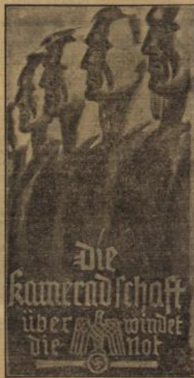
Die Türplafette des WSW für November 1936. (Wagenberg, R.)

Aus der Fülle der Mittel ein gutes Mittagbrot zu schaffen, ist kein Kunststück. Deshalb hat die Hausfrau, die finanziell unbeschwert ist, in dieser Hinsicht keine besondere Bewunderung zu beanspruchen. Ganz anders ist es da, wo geringe Einkünfte Grenzen, oft sehr enge Grenzen ziehen. Mit Geduld und Nachdenken muß die Hausfrau den Mangel überleben. Ein solches Maß läßt in keiner Sorgfalt die Liebe zu den Betreuten, zu Kind und Mann, sichtbar werden; die vom Herzen getragene Verantwortung, den Mann die bescheidenen Einkünfte nicht fällen und das Kind unter den engen Verhältnissen nicht leiden zu lassen. Und sollte es uns schaden, wenn wir alle uns nun an einen etwas bescheidenen Tisch setzen? Sollte es der deutsche Frau nicht möglich sein, das, was ihr für die Familie selbstverständlich ist, auch für die Heimat zu tun, für unser junges Reich? Wenn wir an die Leistungen denken, die die deutsche Frau im Kriege vollbracht, dann wäre ein Zweifel Sünde. Die deutsche Frau wird es schaffen, und der Boden der Heimat bietet soviel Auswahl, daß der gesunde Geschmack und der ehrliche Hunger immer noch zu ihrem Recht kommen.