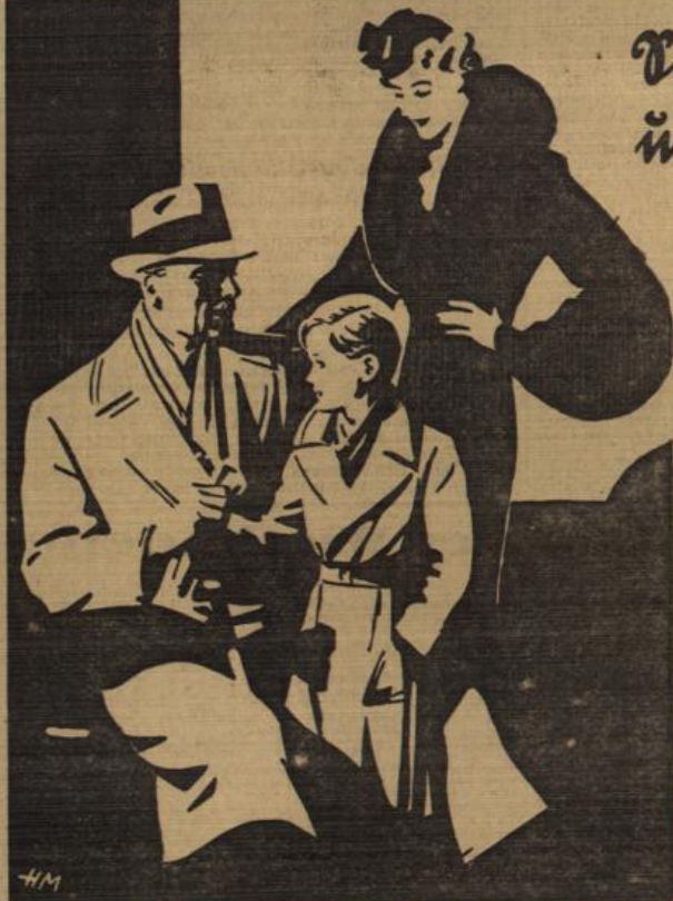
Am Verkehrs-Sonntag von 2.30 bis 6.30 Uhr geöffnet!

Hettlage offene Handelsgesellschaft — (früher Wels) Wiesbaden Kirchgasse 64