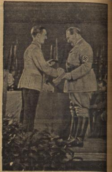
Hermann Göring erhält das Berliner Ehrenzeichen. Nach der Einleitung der großen Rundgebung überreichte Dr. Goebbels Hermann Göring das Berliner Ehrenzeichen, das in Gold gefertigt, 30 der besten und treuesten Berliner Parteigenossen erhalten haben.

Ein mit 15 Personen besetztes Bergarbeitertransportauto wurde auf dem Ball von einem Straßenbahnwagen linksseitig getroffen. Dabei wurde die Wagenseite des Autos weggerissen. Die Insassen, Bergarbeiter, die von der Straße kamen, wurden bei dem heftigen Anprall auf die Straße geschleudert. Ein Arbeiter war sofort tot, die anderen wurden sofort ins Krankenhaus gebracht. Bei einigen der Schwerverletzten muß man leider befürchten, daß auch sie nicht mit dem Leben davonkommen werden. Die Schuldfrage ist noch nicht geklärt. Der Fahrer des Transportautos und sein Mitfahrer kamen ohne Verletzung davon; sie wurden bis zur Klärung der Schuldfrage in Haft genommen.