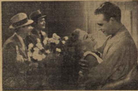
Die „Glückskinder“ sind da — das vorbildliche deutsche Lustspiel der Ufa, das alle Erwartungen übertreffen wird!

Ein glückliches Paar - und zwei Gratulanten!