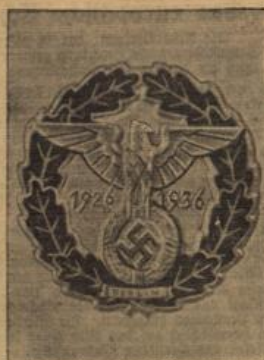
Das goldene Ehrenzeichen für die 30 alten Kämpfer des Gau Berlin.

Dr. Goebbels: Der Kampf gegen die Sozialdemokratie konnte natürlich nirgends eindrucksvoller geführt werden als an ihrem Sitz selbst. Auch findet das Gelingen in der Reichshauptstadt naturgemäß das stärkste Echo im In- und Ausland. Gelang es außerdem, den Marxismus in seiner stärksten Hochburg, in Berlin, zu schlagen, so mußte sich das notwendig auf das ganze Land auswirken. So war der Kampf um Berlin von entscheidender Bedeutung für den Erfolg der Bewegung. Heute nun ist die Reichshauptstadt mehr denn je in den Brennpunkt des Interesses des Auslandes gerückt, hier befindet sich das diplomatische Korps, hier sind die Vertretungen der ausländischen Presse. Das bedeutet eine besondere Verpflichtung auch für die Parteiorganisation in der Reichshauptstadt. Jedem hat Berlin durch seine geschlossene Beziehung die stärkste Organisationsmöglichkeit. Es ist klar, daß sich da vieles leichter durchführen läßt als in den anderen, in Städte und Dörfer aufgesplitterten Gauen. Auch das bedeutet wieder eine Verpflichtung für uns. Der Gau Berlin muß und wird daher stets seine Ehre darin setzen, zu den vorbildlichsten des Reiches zu gehören.