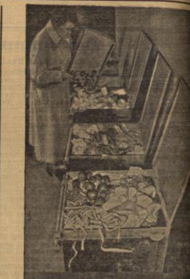
Kampf dem Verderb.

Aus der Entwicklung des Honigverbrauchs ergibt sich nun die dringende Forderung einer bedeutenden Ertragssteigerung der deutschen Bienenzucht. Die Reichsgruppe Imker, der heute über 160.000 Mitglieder angehören, sind, hat darum seit Beginn der Erzeugungsperiode einen umfassenden Plan in Angriff genommen, der zu einer wesentlichen Erhöhung der Durchschnittserzeugungen