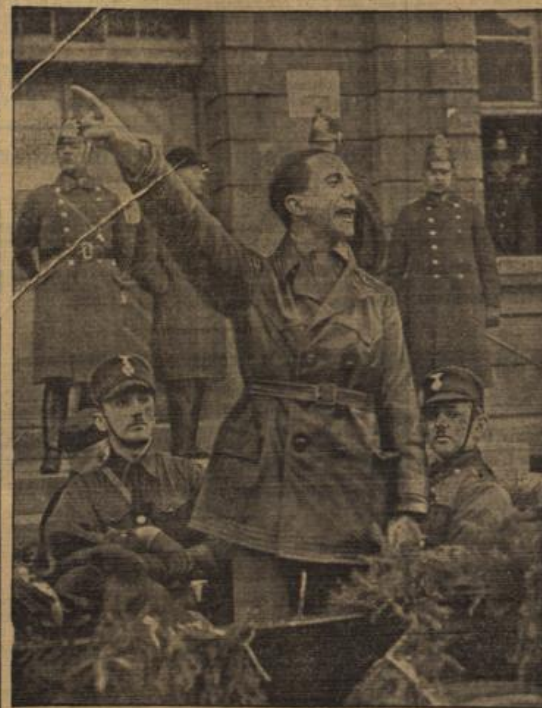
Ein Bild aus der Zeit des Uniformverbotes: SA und SS, ohne Uniform marschierten einheitlich in weißen Hemden mit dem dunklen Schilps und warben für Adolf Hitler.