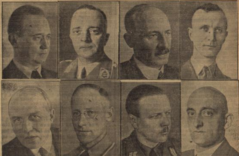
Die Mitarbeiter Görings bei der Durchführung des Vierjahresplanes.

Der Wirtschaft aber muß ich eines sagen: Sie hat eine große Verantwortung. Der einzelne Unternehmer und Industrielle soll nur nicht darauf warten, was der Staat anordnet, was der Staat fördert, sondern er soll von sich allein aus Mittel und Wege suchen und keine Antritte scheuen, um dieses Wort zu unterstützen. Meine Herren Unternehmer! Sie sprechen immer von der freien