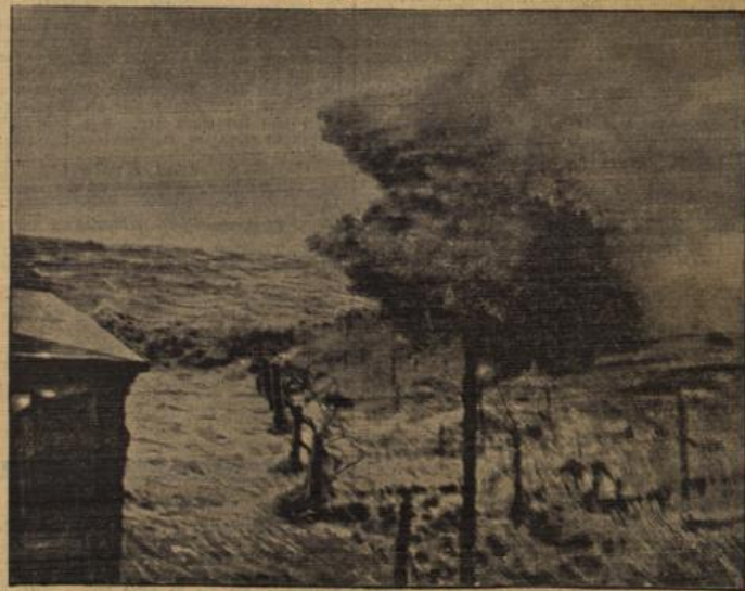
Die gewaltigen Wellen am Freibad von Cuxhaven.

Berlin, 29. Okt. Wie wir von der Deutschen Luftkhanja erfahren wurden während des ungeduldigen starken Sturmes sämtliche Tag- und Nachtflüge den Besatzungen, Es ließ sich freilich nicht vermeiden, daß die meisten Flugzeuge,