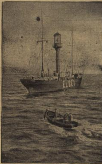
Das gesunkene Feuerschiff „Elbe I“.

Das verlorengegangene Feuerschiff „Elbe I“ gehörte zu den neuesten Feuerschiffen der deutschen Küste. Es wurde im Jahre 1932 erbaut, hat also somit