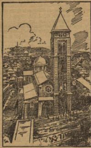
Die Heiligengruft in Jerusalem.

vier Stunden nach Jerusalem und zurück befördert. Die Fahrt, die über das heilige Joppe führt, ist höchst inter-