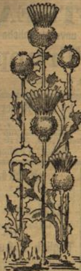
Kontor: Langgasse 27.

besitzt schnell die L. Schallenberg'sche Hofbuchdruckerei Wiesbaden.