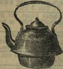
Recht emaillirte Wasserkessel, mit Einsatz ohne Einsatz Mk. 2.— Mk. 1.90.