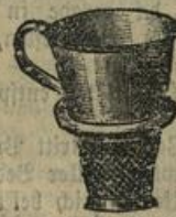
Kaffeetrichter in allen Größen.