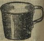
Emaillirter Wasserbecher Mk. —.50.