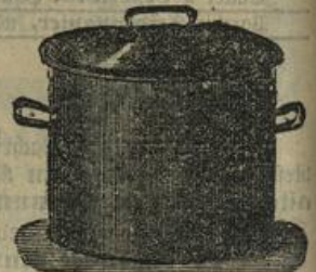
Waschkeffel in doppeltverzinnter Waare, in allen Größen.