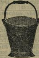
Fein lackirter Wassereimer, groß, Mk. 1.25. Emaillirter Wassereimer, groß, Mk. 2.30.