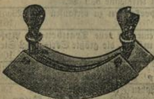
Wiegemeßer, prima Stahl, einfach Mk. —.65, doppelt " 1.25.