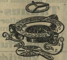
7-flammiger Spiritus-Schnellkocher Mk. —.85.