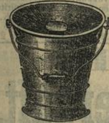
Toilette-Eimer mit Deckel, fein lackirt Mk. 2.50, emaillirt " 3.50.