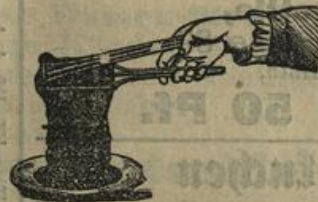
Frucht- oder Butter-Press, dauerhaft, Mk. 1.90.