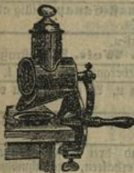
Reibe-Maschine für Brod und Kartoffeln, beste Waare, Mk. 2.25 u. 3.—.