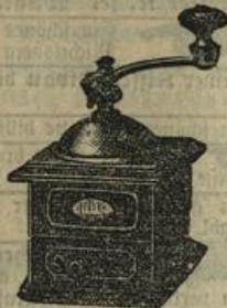
Prima Kaffeemühle zum Selbststellen Mk. 1.80.