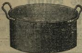
Bestemaillirte Kochtöpfe in allen Größen, billigst. Eiserne Kochtöpfe. Zinnoberne Kochtöpfe.