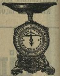
Tafelwaage, prima, 20 Pfd. Tragkraft, Mk. 4.50.