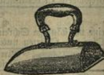
Prima geschmiedete Bügeleisen für Wolzen Mk. 2.75.