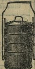
Emaillirte Essthräger, 4-theilig und mit Bügel Mk. 4.—.