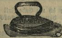
Platteisen, beste Waare, Mk. 1.—.