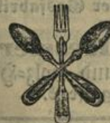
Beste Messer, Gabeln und Löffel außerst billig.