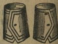
WAGNER Dtzd.-Paar M. 1.20.

Jeder Kragen kann eine Woche lang getragen werden.