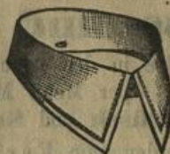
HERZOG Dtzd. M. —.85.

Jeder Kragen kann eine Woche lang getragen werden.