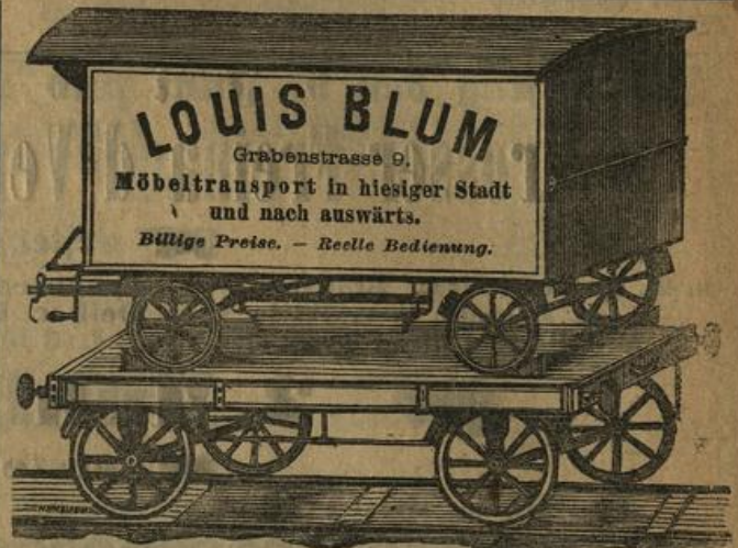
Per Bahn ohne Umladung. 7302

Eischränke, anerkannt bestes Fabrikat (geringer Eisverbrauch) == unter Garantie == in feinsten Lackirung, Fliegenschränke empfiehlt in großer Auswahl zu billigst gestellten Preisen Louis Zintgraff, 13 Neugasse 13. 13876