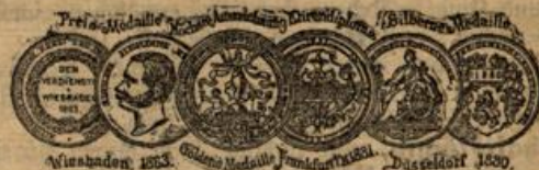
Wiesbaden, 1853. Goldene Medaille Frankfurt 1854. Düsseldorf 1850.

Von heute an verzapfe ich ein sehr gutes Glas Birnwein. 2218 Ph. Noll.