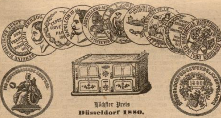
Höchster Preis Düsseldorf 1880.