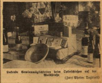
Lebende Gewinnmöglichkeiten beim Dajerschießen auf der Waldhöhe.

Ein gut besuchter Platz war auch in Schierlein zu verzeichnen, wo die Schwarzweissen des SK, 1919 Biechitz empfingen. Das