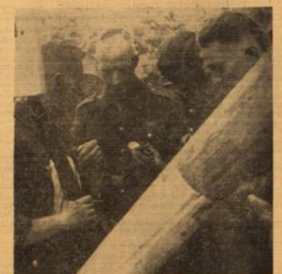
Orientierungsaufgabe am „Schlagbaum“. Der Teilnehmer am ersten Weltkrieg nimmt den Kompaß zur Hand und bald ist von der Mannhaftigkeit die gestellte Aufgabe gelöst.