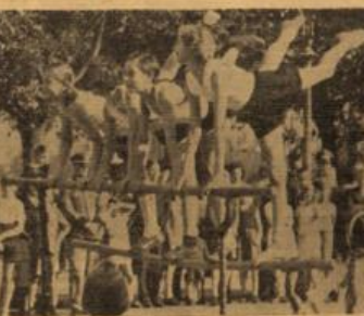
Vorrennen der Wägen im Rahmen der Berufsleistung. Eine Stunde deutsches Turnen auf dem Volkssportplatz.

Überall begehrte Fußballer und sonstige Spender. Das Wagnerebene fand diesmal im Zeichen der ersten Kriegskriegsleistung im Sport. Die Spieler des WSKR, die im August des Jahres waren es, die die schönen Glasplätze und den hohen Reichtum unter großen deutschen Gesichtern abgaben und dafür sorgten, daß die teuren Sammelbüchlein schnell füllten.