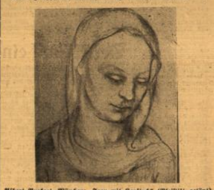
Albert Dufart, München: „Frau mit Kopfstück“ (Weißtuff; getönt)