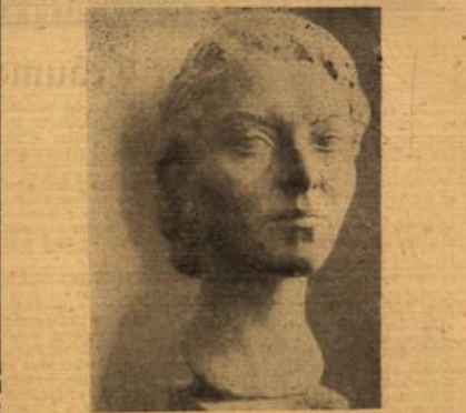
Geete F. Eichmann, Mannheim: „Frauentop“ (Gips; getönt)

In Volkshausen Kunstverein... ladet, diesmal wieder eine reichhaltige Schau, über die wir in der Tagblatt-Ausgabe vom 18. 9. berichteten, zur Beachtung ein.