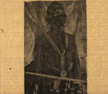
Modell eines englischen Fallschirmjägers