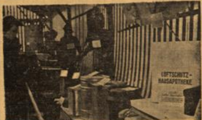
Blick auf die praktischen Luftschutz- und Fliegerübungen