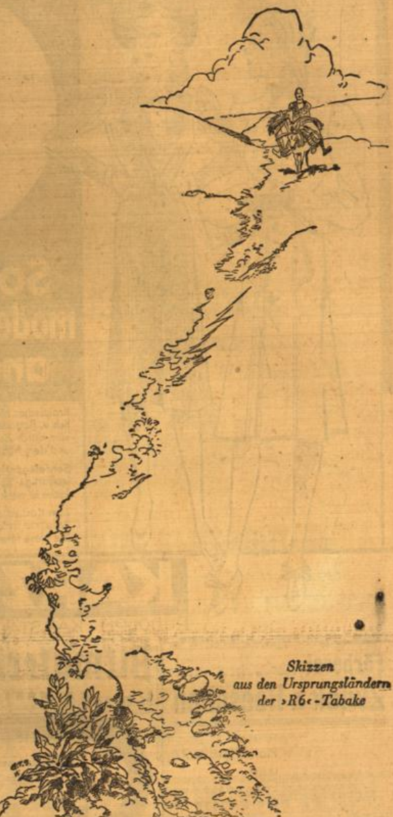
Skizzen aus den Ursprungsländern der »RG«-Tabake