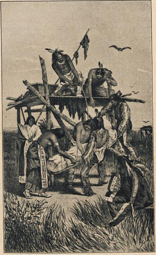
Abb. 1: Gerüstgrab bei den Teton-Sioux. Aufbahren der Leiche. Nach Harrow.

und ethisch niedrigst stehende Art der Totenbehandlung ist das bloße Aussetzen der Leiche, das gemüth- und gefühllose Hinwerfen des Verstorbenen in den Busch, auf die Steppe, den Hund und den Raubtieren zum Fraß. Bei den Indianern Nordamerikas ist es nur von wenigen Stämmen bezeugt; so von den Tinneh oder Athabasken, der nördlichsten Sprachgruppe der Indianer, und den Assiniboin, einem Zweige der großen Dakotafamilie. Bei jenen indessen hat die anscheinend so rohe Methode ihren Grund in den arktischen (nördlichen) Klimaverhältnissen, die ein Begraben in unserm Sinn, also ein Versenken des Toten unter die Erdoberfläche, bei dem stets steinhart gefrorenen Boden einfach nicht gestatten; bei den Assiniboin aber verschmähte man es, den Tapferen das gewöhnliche Luftgrab auf dem hohen Gerüst zu geben, weil sie, wie man meinte, imstande wären, sich auch im Tode noch selbst zu schützen. Dieselben mehr als rauhen klimatischen Verhältnisse verbieten wie für die Tinneh so auch für die Eskimo jede wirkliche Grabanlage. Im Winter verscharrt man die Toten