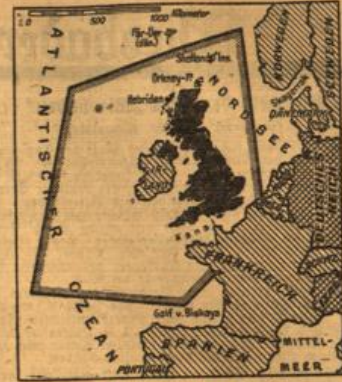
Das Flottengebiet um England

Im übrigen hat die Angst vor der deutschen Invasion in den letzten Tagen noch zugenommen. Die britische Presse schreibt nach einer „riesigen Volksarmee“. Wir wollen“, schreibt der Daily Express, die Verfrachtung neuer Mitglieder für die Heimatwehr, damit diese an die Stelle von Soldaten treten, die in Übersee gebraucht werden.“ Hier wird die Nachkriegsplanung zwischen den deutschen Angriffen auf das britische Mutterland und den italienischen Seefahrern gegen die Positionen des Empire ba, der den vier in sich freiliegenden Flammen wirksam Einhalt gebieten könnte. Das aber all das, was bis bisher ereignet hat, nur ein Anfang ist, darüber dürften die Engländer in Kürze belehrt werden.