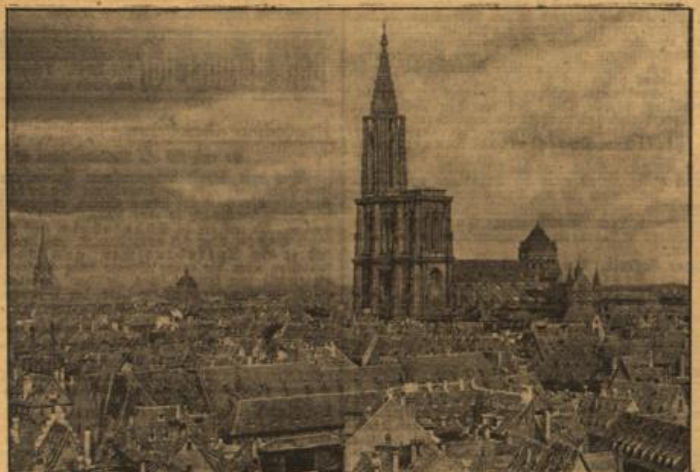
Blick auf das Kaiserzimmer von Ströburg mit dem berühmten Münster, dem unergleichen Kaiserwerk Erbin von Steinböden, über Ströburg, der wunderbaren Stadt, wobei die Zeichen des deutschen Sieges.