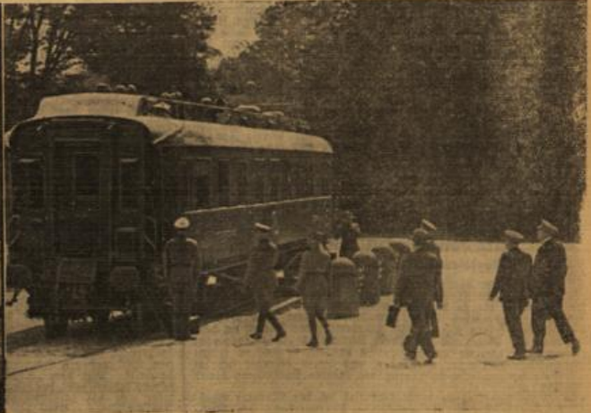
Links: Die französischen Bevollmächtigten schreiten grüßend die Front der Ehrenkompanie ab. (R. Dietrich-Weitbild, R.) - Rechts: Die französischen Unterhändler begeben sich in den Verhandlungsraum. (R. Dietrich-Weitbild, R.)