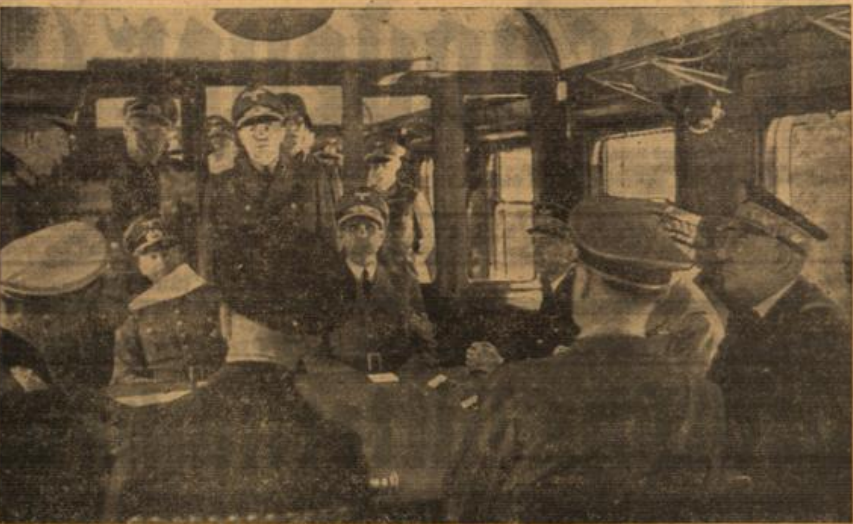
Unser Bild: Generaloberst Keitel, der die Prämie des Führers verließ. Im Vordergrund links Generalmajor Göring, am Hintergrund Generaloberst von Brauchitsch und Reichsminister Heß. Im Vordergrund rechts am Kamerakameraden Dr. e. h. Raeder und Reichsaussenminister von Ribbentrop. Rechts am Tisch General der Luftwaffe Bergeret, in der Mitte der Führer der französischen Delegation, General Hinginger, und ganz links Vizeadmiral Deluc. (Freigegeben: Abuntatur des Führers.)