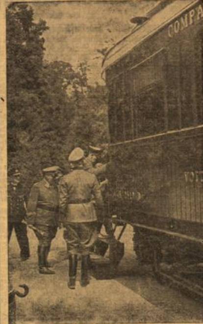
Der Führer begibt sich in den historischen Wagen. Hinter dem Führer Generaloberst Keitel, Generalmajor Dr. a. h. Raeder.