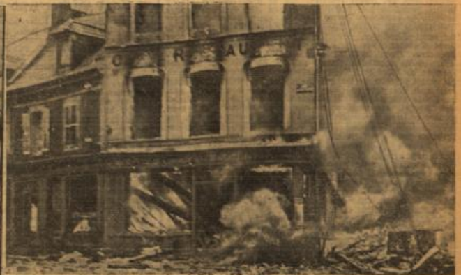
Rainen in Amiens