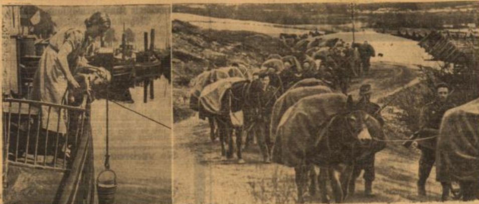
Links: Kubik geht das Leben im Hafen von Rotterdam wieder seinen gewohnten Gang. Mitte: Auf dem Vormarsch im norwegischen Hochgebirge. Deutsche Nachhuttruppen unterwegs. Rechts: Ein Vertreter der „Grande Nation“ in einem deutschen Gefangenenslager. Wie im Weltkrieg, so hat auch jetzt wieder Frankreich seine Häftlinge aus allen Teilen der Erde zusammengetrommelt, um mit den schwarzen „Verteidigern“.