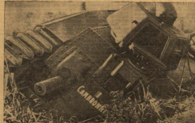
Ein eroberteter schwerer französischer Panzerkampfwagen

Deutsch-italienische Handelsabkommen unterzeichnet. Belgien, 31. Mai. Das Protokoll der deutsch-italienischen Wirtschaftsverbindungen sowie einige Zusatzabkommen zum deutsch-italienischen Handels- und Schiffsverkehrsvertrag vom 24. Mai 1934 wurden am Freitag unterzeichnet.