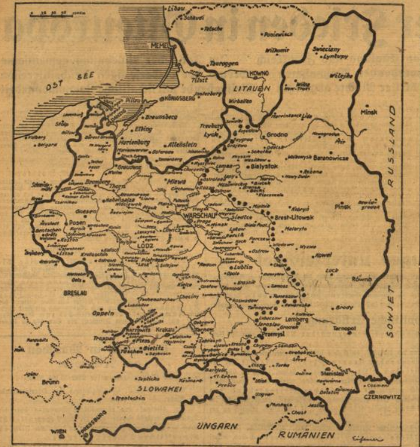
Übersichtskarte zur Grenzziehung. (Eißner-Wagenberg-Dr.)

Der zwischen Estland und der Sowjetunion abgeschlossene Handelsvertrag stellt eine Erhöhung des Warenanlasses zwischen den beiden Ländern um das vierfache ein. Dieser Vertrag ist ein wichtiger Schritt zur Vertiefung der Beziehungen zwischen den beiden Ländern und wird die Entwicklung ihrer Wirtschaft und ihrer Kultur zu fördern.