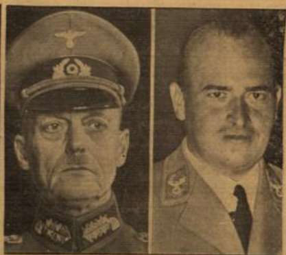
Militärverwaltung in Polen

Dort aber, wo das Blut des Soldaten den Boden tränkt, dort ist die Erde nicht nur heilig, sondern dort hat der Gefallene auch die Erde ganz für sich erobert. Ihm gehört das Stückchen Land, das seinen Körper deckt. Ihm gehört der grüne Regen, der über dem nun wächst, was an ihm veranlaßt ist. Hier hat er die letzte Ruhe. Er war in der Heimat geliebt und hier wird ihm die letzte Ruhe. Er war Kamerad und will nicht wegerufen sein von den Kameraden mit denen er zusammen er kämpfte, mit denen er zusammen er fiel. Er trug den gleichen Soldatenrock, er will das gleiche schlichte Grab. Dort, wo er begraben ist, ist sein Reich und auferstehend zum Märtyrer in die große Armer, soll sein Reich ruhen und nicht ungeschützt und nicht wegerufen werden aus der Kameradenschaft der Schwermigen. Denn der Soldat weiß, daß die Heimat ihm nicht nur für sein Opfer dankt, sondern daß diese Heimat auch sein Grab hütet als folkbarstes, ewiges Eigentum der Nation.