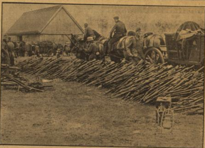
Eine kleine Waffenammlung. Erbeutete polnische Gewehre werden gezählt.