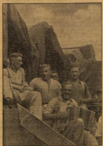
.... und es heißt Ernt'! Bei einem Kampfschwimmer in der Frelauf. (FR. Weissenau, R.)