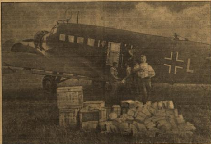
Unter Bild vom Kampf um Warschau zeigt einen deutschen Bomber, der Lebensmittel nach Warschau bringt. (BR-Autofoto-Beitbild, K.)

Die dänische Regierung hat, wie amtlich bekanntgegeben wird, ihren Gesandten in London, Grafen Bernadotte, angewiesen, im Namen der isländischen Regierung bei der englischen Regierung Protest zu erheben. Die ausländischen Interessen Islands werden bekanntlich nach dem das dänisch-isländische Verhältnis regelnden Bundesvertrags von 1918 von Dänemark wahrgenommen.