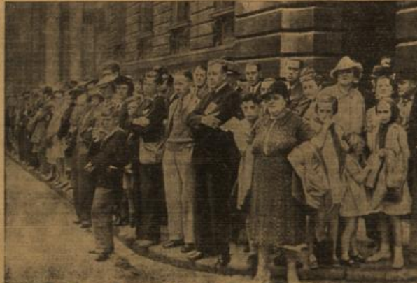
Die Downing Street in London trägt wieder das Kreuzeisen. (Eberl-Wagenborg-M.)

Die Zeitung „Tribuna“ betont, daß Deutschland auf seinen Forderungen bestände und Warschau kein anderer Weg bleibe — und zwar ohne weiteres verhängnisvolles Fögern — dem zuzuhörten, was das Reich im Namen seines nationalen Rechtes fordere. Denn die Einfreisungspolitik, die von den Demokratien mit einer ungläublichen Überheblichkeit und Provokation verfolgt wurde, habe endgültig Schiffbruch gelitten.