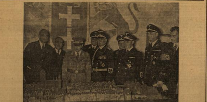
Die Eröffnung der Königsberger Dämelle.

Schanghai, 21. Aug. (Zuntmeldung.) In der vergangenen Nacht kam es in Schanghai zu den ersten größeren Lebensmittelunruhen, als über 500 Kulis in Schanghai in der Nacht zum Sonntag mehrere hundert Saal Reis wegzunehmen, bevor ein Polizeieinsatz morgen stellen die Verhaftungen der internationalen französischen Niederlassungen die Reisgeschäfte unter dem Schutz der Polizeiwachen. Die Unruhen wurden dadurch verursacht, daß die Reisgeschäfte die Erntezeit der Reisfelder auszunutzen, die nach amtlichen Statistiken kaum übersteigt, länger als drei Wochen zu verlieren, auf dem Demersmarkt Reisbestände horten in Erwartung eines weiteren Anstiehs der Reiserente, die bereits auf das dreifache gestiegen sind.