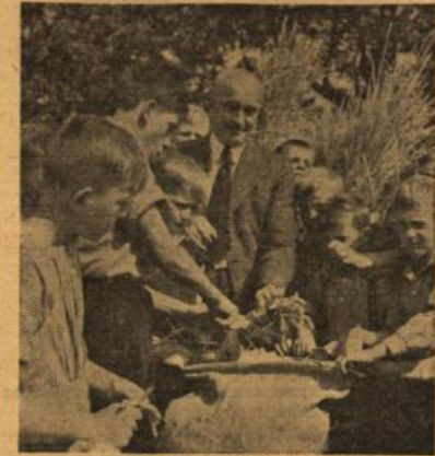
Nin in den Sad...

zu, den diese Kinder (es sammeln die Klassen vom 1. Schuljahr an aufwärts) bereits lebendig erleben können. Sie lernen in jeder legenswerten Ähre die Brotfrucht achten und sammeln sie als ihren persönlichen Beitrag zur Nahrungshilfe in farger Winterzeit. Jede Klasse von