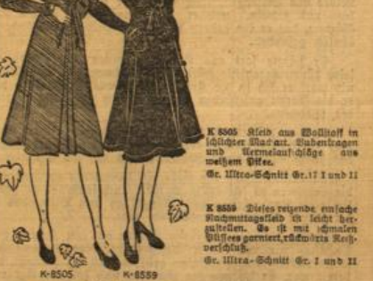
K 8505 Kleid aus Wolleff in dunkler Blau, Aufschlägen und Kermelauflage aus weissen Stoffe. Gr. Ultra-Schnitt Nr. 17 I und 11

Das Badewasser sollte so weit wie möglich weis gemacht werden. Wenn wir nicht die Gebuld haben, Regenwasser aufzulagern und zu verwenden, dann legen wir dem Badewasser des Gelmad Zusatz zu, das wir in jeden einlässigen Gefäßchen erhalten.