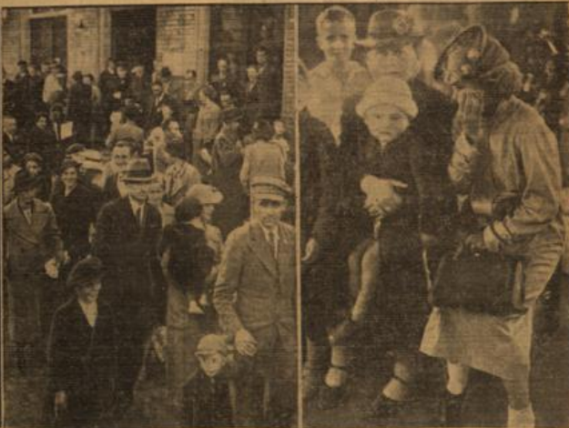
Schon über 70 000 Flüchtlinge.

Nach den zahlreichen Verhaftungen Volksdeutscher in Ostoberschlesien wurden jetzt auch von polnischer Seite die Grenzübergänge nach Deutschland gesperrt. Unter Bild zeigt den gesperrten Grenzübergang bei Beuthen. Früher passierten hier täglich über 6000 Personen, die in Deutschland Arbeit und Brot fanden, die Grenze.