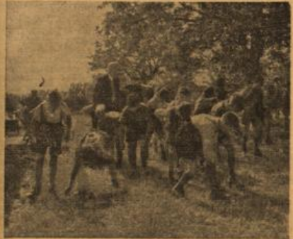
Den aufmerksamen Sammlern entgeht kein Halmchen.

Neben der beträchtlichen materiellen Bedeutung dieser Aktion unserer Volksschulen kommt ihr ein ideeller Wert