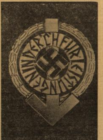
Das Führer-Sportabzeichen der HJ. Dem Jugendführer des Deutschen Reiches Salbur von Schwarz gestiftet, wird an die HJ-Führer verliehen, die im Führer-Junkampf der Hitler-Jugend, der am Sonntag stattfand, 7500 Punkte erreichten.

Die Bekannten haben unter Ausnutzung der außerordentlichen Nachfrage nach Kraftfahrzeugen im Zusammenhang mit dem Kriegsausbruch die Preise unter Verletzung der Preisvorschriften fortgesetzt wettbewerbsfähig erhöht.