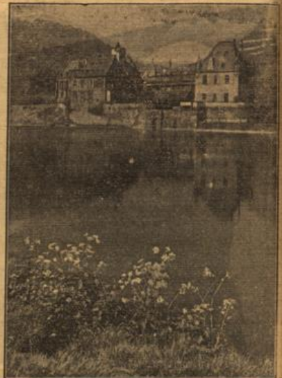
Am schönen Moselstrand... Am burgreichen Strande der Mosel, auf der eine Dampferfahrt zu machen mit zu den schönsten Annehmlichkeiten der Ferienzeit zählt, begegnet uns auch das Stimmlich des Gärtengelechtes (zur Rupp-Wagenberg, RR.)

Der Reichswirtschaftsminister hat mit sofortiger Wirkung neue Bestimmungen über die Mitnahme von Zahlungsmitteln im Reiseverkehr nach dem Protektorat Böhmen und Mähren erlassen. Danach dürfen im Reisegebiet anfallende Reisende, soweit sie auf Grund der für die Einreise nach dem Protektorat Böhmen und Mähren geltenden besonderen polizeilichen Bestimmungen zur Einreise in das Protektorat berechtigt sind, ohne Genehmigung der Deutschen Reichsmarktgeldorten bis zum Betrag von 300 RM. mitnehmen, soweit nicht in den zum Grenzübertritt berechtigenden Papieren ein niedrigerer Betrag festgelegt ist. Höhere Beträge können nur mit Genehmigung der Deutschen Reichsmarktgeldorten mitgenommen werden. Es wird zur Vermeidung von Mißverständnissen ausdrücklich hervorgehoben, daß durch diese Bestimmungen die polizeilichen Vorschriften für die Einreise in das Protektorat Böhmen und Mähren nicht berührt werden.