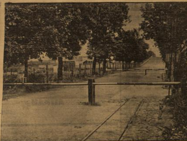
Polenterror in Ostoberschlesien.

Nach den zahlreichen Verhaftungen Volksdeutscher in Ostoberschlesien wurden jetzt auch von polnischer Seite die Grenzübergänge nach Deutschland gesperrt. Unter Bild zeigt den gesperrten Grenzübergang bei Beuthen. Früher passierten hier täglich über 6000 Personen, die in Deutschland Arbeit und Brot fanden, die Grenze.