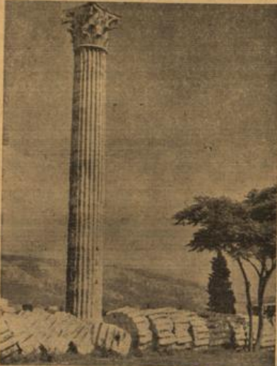
Säulengasse des Parthenons von Athen.

Vom Hafen Piräus sieben sich lange Häuserzeilen bis zum Zentrum der Stadt. Gepflegte Restaurants, elegante Geschäfte, Kinos, Cafés, moderne Regierungs- und Verwaltungsgebäude, große Banken zeigen das neuzeitliche Gesicht der Millionenstadt Athen. Schon am frühen Morgen