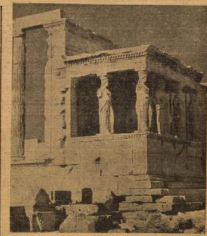
Der Propyläentempel auf der Akropolis.

Auf den ersten Blick kann die strenge griechische Landschaft, wie sie heute ist, enttäuschen. Griechenland ist ein entwaldetes Land. Was das, was die Auslandsdeutschen in Athen immer wieder vermischen, den fühlten, stundenlangen Wald der deutschen Heimat. Dann aber durchdringt das Licht die Landschaft, dieses scharfe und doch so milde Licht der griechischen Sonne. Man kann hier nur schwer sagen, ob ein Gegenstand nah oder fern. Das Licht bringt die kleinste Einzelheit greifbar nah und nimmt damit auch der Landschaft ihre Härte. Aus solchem Licht nur konnte der Geist