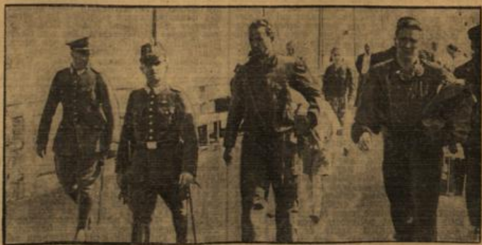
Flugzeugdampfer rettet abgestürzte Polenflieger.

Danzig, 9. Aug. Der „Danziger Vorposten“ veröffentlichte das Faksimile eines Briefumschlages des berechtigten englischen „Propagandagener“ King-Hall, der sich ausgerechnet den Führer der Danziger SD. ausgesucht hat, um ihn mit seinem Brief zu beehren. Das Interessante an diesem Schreiben des „allen englischen Seemanns“ dürfte die Tatsache sein, daß er endlich einmal einen Lichtblick gebracht hat. Auf seinem Briefumschlag steht als Bestimmungsort: Danzig, Germany! Ist King-Hall bemerkt geworden, daß seine Briefe doch nichts ändern können? Wir aber nehmen zur Kenntnis: Für England ist es klar: Danzig gehört zu Deutschland. Danzig in Germany!