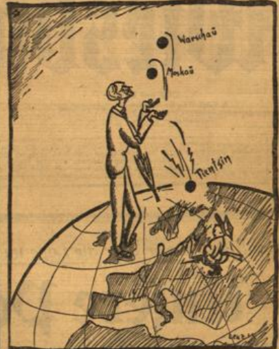
Der politische Jonakur. Nicht wahr, Onkel, meine Kugel läßt du nicht fallen? (Lies-Bogenborn, R.)

Die Verhandlungen zwischen Vertretern des britischen Schachtmates und der polnischen Delegation über einen britischen Rüstungskredit an Polen wurden am Montag fortgesetzt. „Press Association“ rednet damit, daß gegen Ende der Woche wenigstens eine Verlautbarung über den Verhandlungsstand veröffentlicht werden wird.