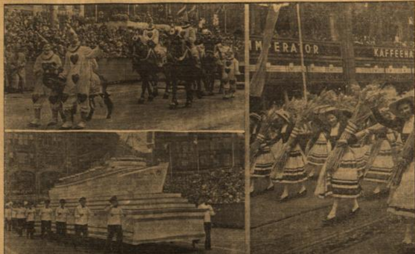
Aus dem glanzvollen Festzug zur 3. Reichstagung der NSD. „Kraft durch Freude“ in Hamburg. Der glanzvolle Festzug, aus dem wir hier einige Ausschnitte zeigen, krönte den Schlußtag der 3. Reichstagung „Kraft durch Freude“ in Hamburg. Oben: Eine lustige Gruppe. Unten: Ein zierliches Modell des „Bus der Ernte“. (Rechtsbild, A.)

Aus der Zusammenfassung des neuen Kabinetts ist ersichtlich, daß Colijn eine Regierung liberaler Prägung mit Ausschluß der Katholiken gebildet hat. Die katholische Presse richtet schon jetzt, ehe noch die amtliche Ministerliste veröffentlicht wurde, scharfe Angriffe gegen Colijn und bezeichnet das neue Kabinett als Zwischenslösung. Es ist daher anzunehmen, daß die neue Regierung in der Kammer, wo Katholiken und Sozialdemokraten in der Mehrheit sind, einen schweren Stand haben wird.