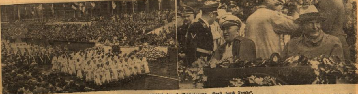
Ganzpöcker Abschluß der 5. Reichstagung „Kraft durch Freude“. Mit dem großen Festzug „Schönheit und Freude“ (links) erreichte die 5. Reichstagung der NS-Gemeinschaft „Kraft durch Freude“ in Hamburg ihren glanzvollen Höhepunkt. (Rechts: Generalfeldmarschall Göring und Reichsorganisationsleiter Dr. Ley auf der Ehrentribüne während des Festzuges.)