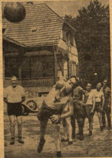
Mit kräftigem Schwung wird der Ball gemoren.

Nach einstündiger Ruhepause wurde nun zum Sport angetreten. Es wurden vier Mannschaften gebildet, die im Dreikampf ihre Kräfte mähren. Während auf dem Platz vor der Erholungsstätte der Medioball gefolien wurde, fand auf einer Waldlichtung Reulenwettkampf in einen 25 Meter entfernten Kreis statt. Der Dreikampf endete mit einem Tau-