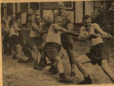
Saunrund, siehe unten!

Als der Samstag langsam zu Ende ging, die Quartiere bezogen und die Klänge in feierlicher Form eingesogen worden war, waren im Ru Dische und Stühle von der Beranda des langgestreckten Sommerhauses aus Freizeitsport, von dessen Holzgalerien bunte Kämpfer und Champions leuchteten. Auf der aufreißenden Tafel wurde ein schmackhaftes Essen aufgetragen, während eine kleine Kapelle ihre Weiten zu spielen begann, lustige und auch etwas beklagliche, wie es gerade so kam, Groß und Dunkel erhoben sich um den freien Hofplatz die in der Dämmerung