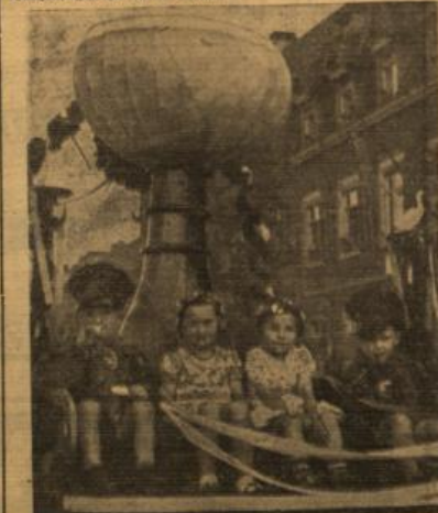
Die Kerbe-Gesellschaft feiert ihren 30. Geburtstag.

Nach Auslösung des Jubelkrumens die Rollen zum Festtag, der bis in die späten Nachstunden hinein dauerte. Zwei Kapellen traten für Unterhaltung, und zwei große Zuschauer mit Gibber Kerbe verhalten den Anlässen zu ihrem Recht.