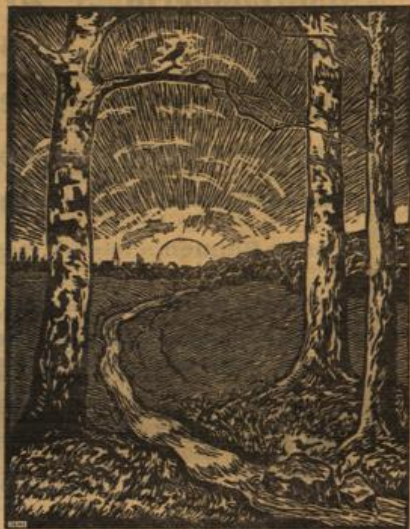
Früchte sind gekommen. (Holzschnitt von A. Grimm-Sachsenbata.)

Mittelschicht wird in Tripolis eine Mutterernte veranstaltet, die einen guten Rückblick auf die in Libyen geleistete Arbeit gibt. Da wird gezeigt, was sich aus dieser unfruchtbareren „Streulandschaft“, wie die Kolonie oft neugierig genannt wurde, bei eifrigem Fleiß herauszubringen läßt. Viel bringen im Herzen der libyschen Wüste, im sogenannten