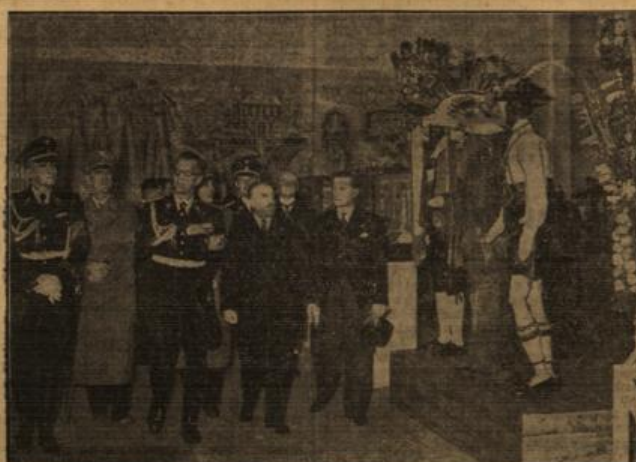
Nach der Eröffnung der Ostmark-Ausstellung. Berlin, 26. Mai. Reichsminister Dr. Senß-Inquart, der gesamte Stab in einem ausführenden Kommando vorführt. Das Bild zeigt den Minister und seine Begleiter in der Ausstellungshallen.

Sonabend, 26. Mai. Vertreter der Oppositionsparteien hielten es am heutigen Freitag, am letzten Tage vor den Wahlen des Parlaments, für angebracht, das Unterhaus mit der Frage der Anerkennung des Protokolls zu