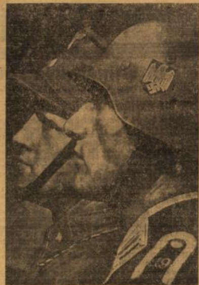
Wehrmacht und SA.