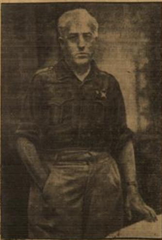
General Vogau kommt nach Berlin.

Königin Wilhelmina von Holland teilte Freitag nach Beendigung ihres Staatsbesuches wieder nach Holland zurück. Am Donnerstag hatte sie nach die Internationale Ausstellung in Königsbrunn besucht. Zur Abreise der Königin, die mit König Leopold durch die geschmückten Straßen von Bahnhof fuhr, hatte sich wieder eine große Menschenmenge eingefunden.