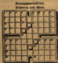
Reuzworträtsel. Diktoria und Wert.

Wörterbuch: 1. Diktoria in Diktoria, 1. Diktoria, 2. Diktoria, 3. Diktoria, 4. Diktoria, 5. Diktoria, 6. Diktoria, 7. Diktoria, 8. Diktoria, 9. Diktoria, 10. Diktoria, 11. Diktoria, 12. Diktoria, 13. Diktoria, 14. Diktoria, 15. Diktoria, 16. Diktoria, 17. Diktoria, 18. Diktoria, 19. Diktoria, 20. Diktoria, 21. Diktoria, 22. Diktoria, 23. Diktoria, 24. Diktoria, 25. Diktoria, 26. Diktoria, 27. Diktoria, 28. Diktoria, 29. Diktoria, 30. Diktoria, 31. Diktoria, 32. Diktoria, 33. Diktoria, 34. Diktoria, 35. Diktoria, 36. Diktoria, 37. Diktoria, 38. Diktoria, 39. Diktoria, 40. Diktoria, 41. Diktoria, 42. Diktoria, 43. Diktoria, 44. Diktoria, 45. Diktoria, 46. Diktoria, 47. Diktoria, 48. Diktoria, 49. Diktoria, 50. Diktoria, 51. Diktoria, 52. Diktoria, 53. Diktoria, 54. Diktoria, 55. Diktoria, 56. Diktoria, 57. Diktoria, 58. Diktoria, 59. Diktoria, 60. Diktoria, 61. Diktoria, 62. Diktoria, 63. Diktoria, 64. Diktoria, 65. Diktoria, 66. Diktoria, 67. Diktoria, 68. Diktoria, 69. Diktoria, 70. Diktoria, 71. Diktoria, 72. Diktoria, 73. Diktoria, 74. Diktoria, 75. Diktoria, 76. Diktoria, 77. Diktoria, 78. Diktoria, 79. Diktoria, 80. Diktoria, 81. Diktoria, 82. Diktoria, 83. Diktoria, 84. Diktoria, 85. Diktoria, 86. Diktoria, 87. Diktoria, 88. Diktoria, 89. Diktoria, 90. Diktoria, 91. Diktoria, 92. Diktoria, 93. Diktoria, 94. Diktoria, 95. Diktoria, 96. Diktoria, 97. Diktoria, 98. Diktoria, 99. Diktoria, 100. Diktoria.