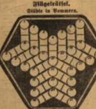
Magisches Quadrat. Zahlen in Form.

Närrätselung. (A) - (B) + (C) - (D) = (E) + (F) + (G) + (H) + (I) + (J) + (K) + (L) + (M) + (N) + (O) + (P) + (Q) + (R) + (S) + (T) + (U) + (V) + (W) + (X) + (Y) + (Z).