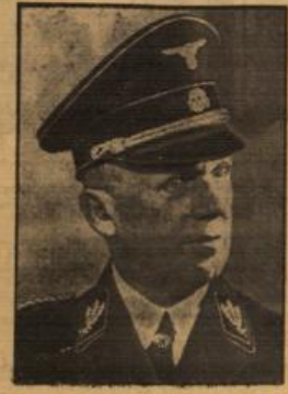
Reichsminister Dr. Lammers 68 Jahre. Der Chef der Reichskasse, Reichsminister Dr. Hans Heinrich Lammers, besucht am 27. Mai seinen 60. Geburtstag.

Wenn die verderblichen Einwirkungsbestrebungen der demokratischen Weltmächte sich immer mehr entfernen von einer friedlichen Lösung der Probleme, die der Neuordnung Europas im Wege stehen, wenn sie den Kampf von Versailles aus dem Innern über Mostau und im Sinne mit den weltverderblichen Kräften des Bolschewismus triumphierten lassen möchten, so verfordert die durch den deutsch-italienischen Bündnispaß auf Neue befestigte Politik der Abwehr den mehreren Vorkämpfer den Geist der Abwehr des unangenehmen Stiefes der 150 Millionen zum Siege führen wird.