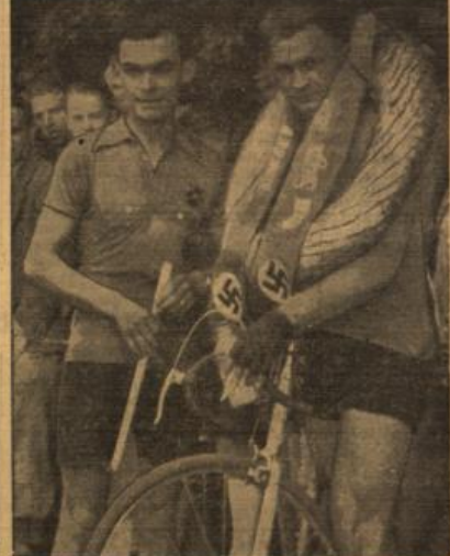
Sie gewannen „Rund um den Neroberg“. Links: B. A. Schweinfurt (Klasse O), rechts: Seufert-Schweinfurt (Klasse A, B).

am zu Fall und fiel zurück, um in der zweiten Runde wieder aufzuliegen, bis er doch aufstach. In der zweiten Runde lag die A-Klasse der B-Klasse schon näher auf die Ferien gerückt. Der Frankfurter Vindemann gibt infolge einer schmerzenden Halswunde auf. Hier und da liegen die ersten Fahrer und begeben Defekte. Die C-Klasse sieht nicht schlecht aus auf einige Zurückgefallene ihre Bahn. Die dritte Runde bringt dann die A-Klasse ihren Aufstieg zum Halbholts auf die B-Klasse heran. Der Wiesbadener E. Schmidt fällt zurück, und J. Müller vor R.R.