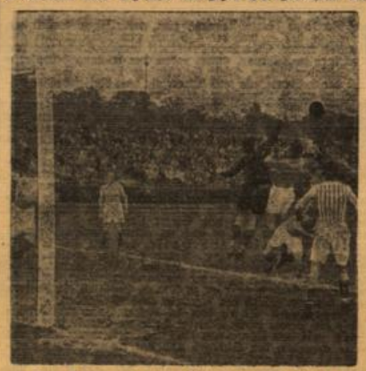
Gute Deutungsarbeit der Hirschheimer, Dreisbach vor Hanenberger.

In ein Idealistisches Formteil sind die Wiesbadener binnengeraten. Konnte man für das Innappe 5:4 in Wiesbaden noch einige halbwegs erläuternde Hinweise ins Feld führen, so entfallen diese angesichts der gegen SS. Hirschheim auf