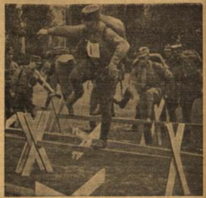
Überwindung von Drahthindernissen nach Beendigung des 20-Kilometer-Marsches.

11/80 12.5. Std.; 2. Gähler 22/80 12.7. Std. (B): 1. Schaub 12/80 12. Std.; (C): 1. Giegerich 14/80 14.01. Std.; 2. 200-Meter-Lauf (A): 1. Geibel 11/80 25.4. Std.; 2. Schulmeier 11/80 25.8. Std.; 400-Meter-Sinbernislaufl: 1. Bickhühler 11/80; 2. Luitler Wehrkampf (A): 1. Kunz 12/80; (B): Wener 21/80; 3000-Meter-Lauf (A): 1. Wittel 2/80, 10:23.4 Min.; (B): Schmiding 22/80, 10:47; Steinköhen (B): 1. Schaub 12/80 8.21 Meter; (C): Giegerich 14/80 6.92 Meter; Sandgranatenwurf (A): 1. Schaub 11/80 55 Meter; (B): Schaub 12/80 50 Meter; (C) Hartwicher 4/80 49 Meter; Kugelstößen (A): 1. Kunz 12/80 10.34 Meter; (B): Schaub 12/80 11.15 Meter; (C): Giegerich 14/80 8.98; Weitzung (A): 1. Kunz 12/80 5.50 Meter; (B): Schaub 12/80 5.70 Meter; (C): Thum 4/80 4.50 Meter.