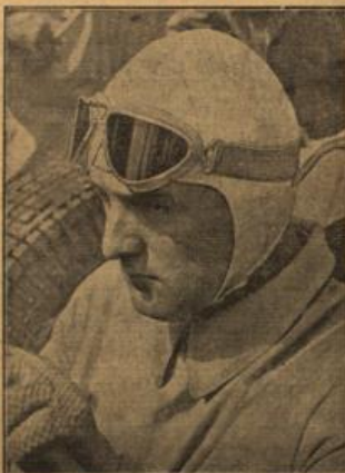
Hermann Lang (Mercedes-Benz) errang in diesem Jahre seinen 3. großen Sieg.

Der Kampf der Rennwagen, der über 10 Runden führte, war von Anfang bis zu Ende mit einem außerordentlichen Maß von Spannung geladen. Lang, Caracciola und Ruvolari standen in der ersten Startreihe vor Seaman und von Brauchitsch, Müller, Biagali und Hoff. Die Rennfahrer Biagali, Joo und Dipper sowie der Franzose Etancelin machten den Galop. Beim Startgalop war es Biagali, der mit ein paar der Seine gefälliger Weis auf die Spitze fuhr. In der Gegenströmung hatte jedoch Lang ihn schon abge-