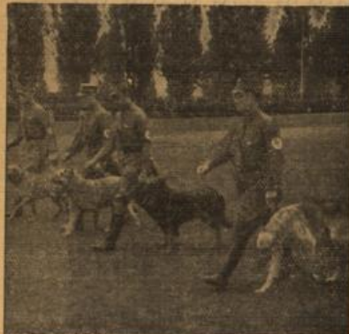
Die niederbainigen Freunde der SA-Männer gehörten aufs Wort.

ins Gelände. Hierbei kommt es nicht allein darauf an, daß jeder einzelne Mann seine Pflicht tut, sondern hier liegt der Sinn darin, daß die Mannschaft geschlossen ihre Aufgaben erledigt. Neben der körperlichen Leistung tritt hier der Kameradschaftsgeist tiefst in Erscheinung. Und sie gehen all ihr Bestes her. Wir haben die Kameraden hatten beim 20-Kilometer-Orientierungslauf, beobachtet eine Kadette, welche beim Nehmen des natürlichen Hindernisses — eines Geländers mit anschließendem Graben — in der Nähe der Wehrtrübungsstelle und lagen dort an den Schießständen, wie die Männer ihre SA-Erziehungen erlebten.