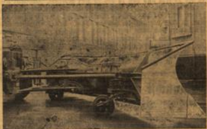
Diese beiden Schneepflüge werden bis zum Herbst angeschafft.

aufstellt und wird deren Zahl noch weiter vermehrt, sobald den Fahrgästen ein überall Geleitetes neben in den Abfall in diese Körbe zu werfen.