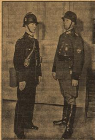
Unter Bild zeigt rechts die neue und links die alte Uniform der Feuerschutzpolizei.

Durch das Gesetz vom 23. November 1938 sind die Berufsfeuerwehren als Feuerschutzpolizei in das Korps der deutschen Polizei eingegliedert worden. Um auch äußerlich die Zugehörigkeit der Feuerschutzpolizei zur deutschen Polizei zu dokumentieren, ist eine Angleichung der Feuerwehrendienstkleidung an die Uniform der Ordnungspolizei vorgesehen. Der Reichsführer SS und Chef der deutschen Polizei