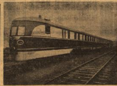
Der neue Schnelltriebwagen FDI 50/49.

Wir hatten Gelegenheit, eine Probefahrt des neuen Schnelltriebwagens mitzumachen und waren überaus von