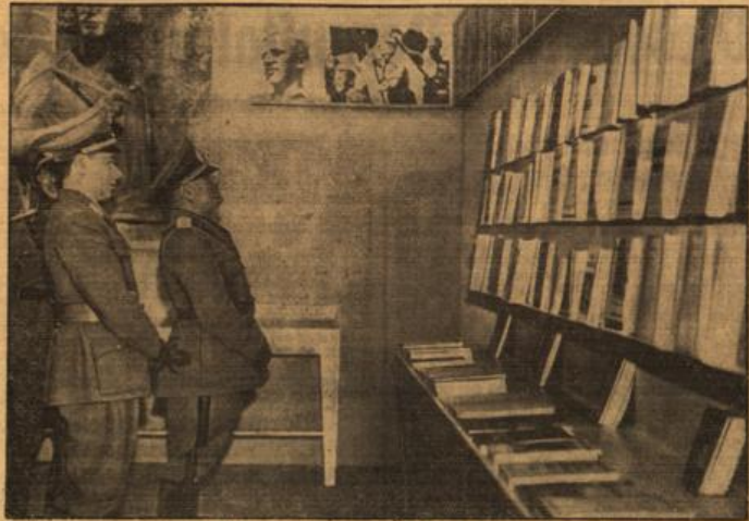
Der Duce auf der Deutschen Buchausstellung in Rom. Mussolini beschäftigt mit starkem Interesse die unter dem Protektorat des deutschen Botschafters v. Radenien und des italienischen Ministers für Volksbildung, Alfieri, lebende Deutsche Buchausstellung in Rom.

1939. Am 6. und 7. Mai. Zusammenkunft der Außen- minister von Ribbentrop und Graf Ciano in Oberitalien. Pakt von Mailand. Politische und militärische Schicksalsge- meinschaft als Gegenstück auf die Entzweiungspolitik der demokratischen Mächte.