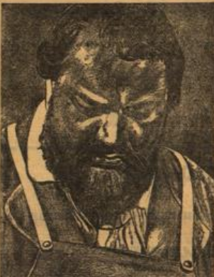
M. Zeichnung: Legier - Tobis Heinrich George als Peter Henlein in dem Veit Harlan-Film der Tobis „Das unsterbliche Herz“