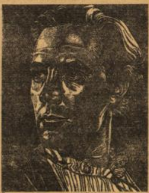
Raimund Schelcher stellt sich in dem Veit Harlan-Film der Tobis „Das unsterbliche Herz“ als jugendlicher Liebhaber vor. (Seine Partnerin ist Kristina Söderbaum)