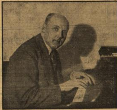
Professor Walter GieseKing.

härteste mir den internationalen Klang des Namens GieseKing, sah ich das Bildnis des Pianisten und es war nicht schwer, daraus zu entnehmen, was er für die deutsche Kunst und Deutschland überhaupt erlebt: „Ich habe 1938 ein sehr bedeutendes Werk erlebt: die „Daphne“ von Richard Strauss.“