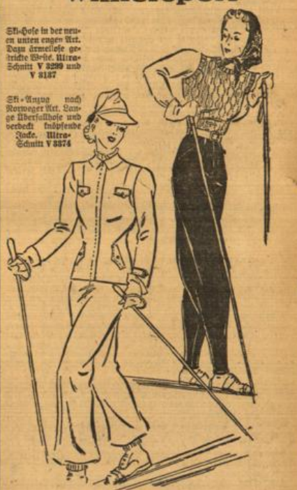
St-Hefe in der neuen unten engen Art. Dem ärmellose gebrühte Weis, Hirs-Schnitt V 8187 und V 8187