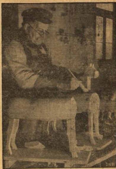
Obenwälder Holzschneider bei der Arbeit für den Weihnachtstisch.

In der Werkstatt der Obenwälder Holzschneider. Wie bald wird Weihnachten sein! Schon werden über all die Vorbereitungen für den Gabelstich getroffen.