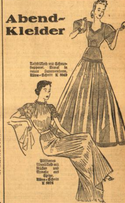
Zwölfteil mit Schmelz-Appretur. Kinn in neuer Schmelz-Appretur. Ultra-Schnitt K 8049