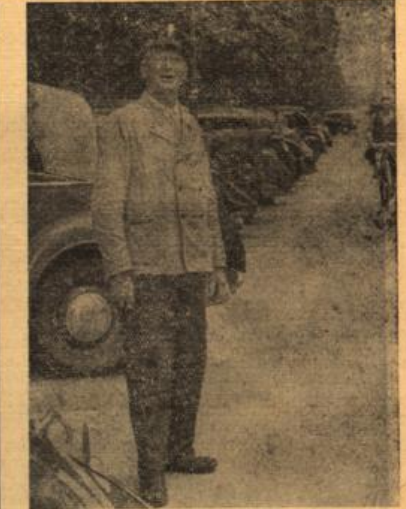
Er muß immer auf dem Posten sein.